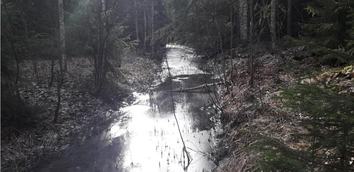
Noron suoristettua yläosaa