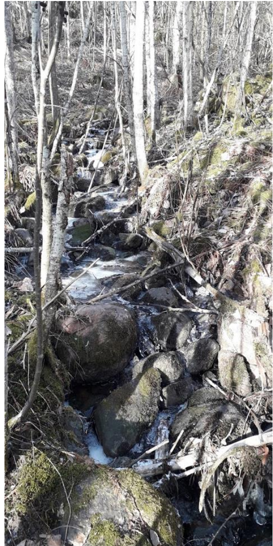
Noron luonnontilaista, kivikkoista ja sorapohjaista osuutta