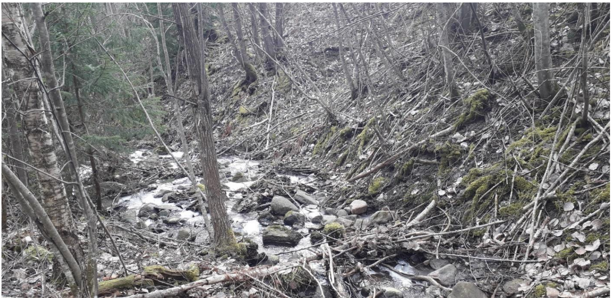
Luonnontilaisen alaosan jyrkkärinteistä osuutta